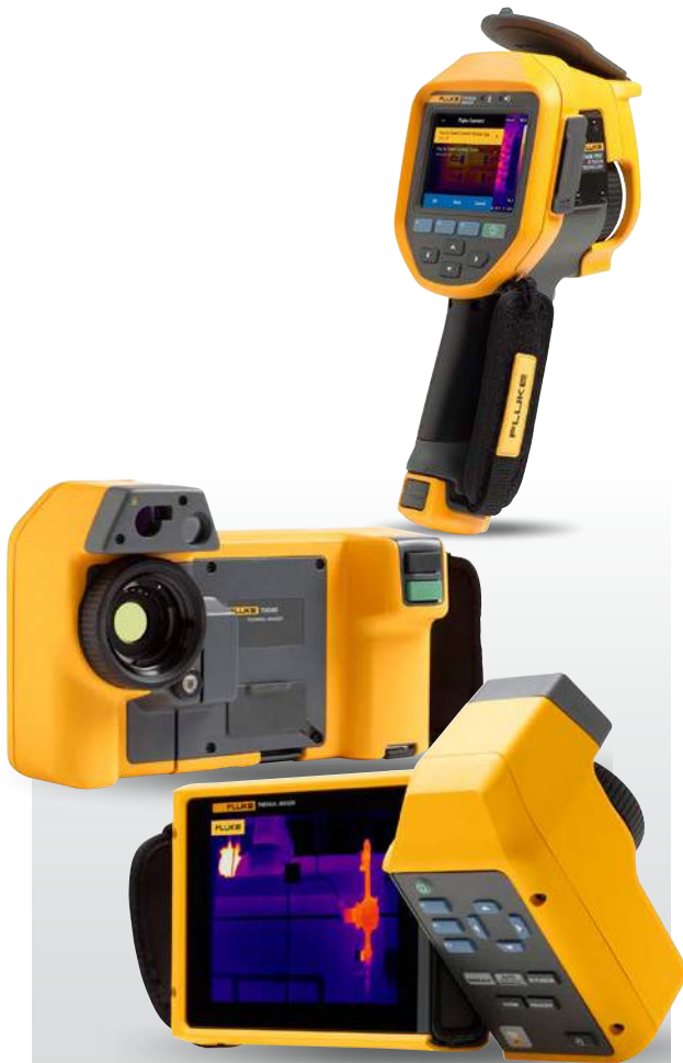
IMAGEM COM QUALIDADE SUPERIOR